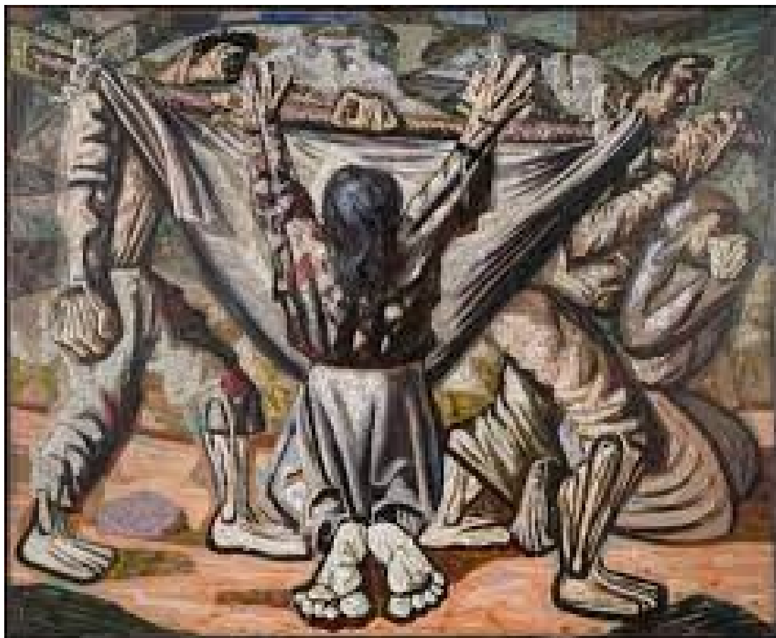
Enterro na rede, 1944.

No quadro “Retirantes”, a mãe segura o filho, um bebê que se diferencia dos seus irmãos presentes na pintura. Há para ele, no ombro da mãe algum conforto e alento, o colo materno lhe oferece segurança. Seu corpo não possui traços definidos por talvez, estar envolto em um manto, mas mesmo seu rosto não possui fortes expressões como dos outros personagens.