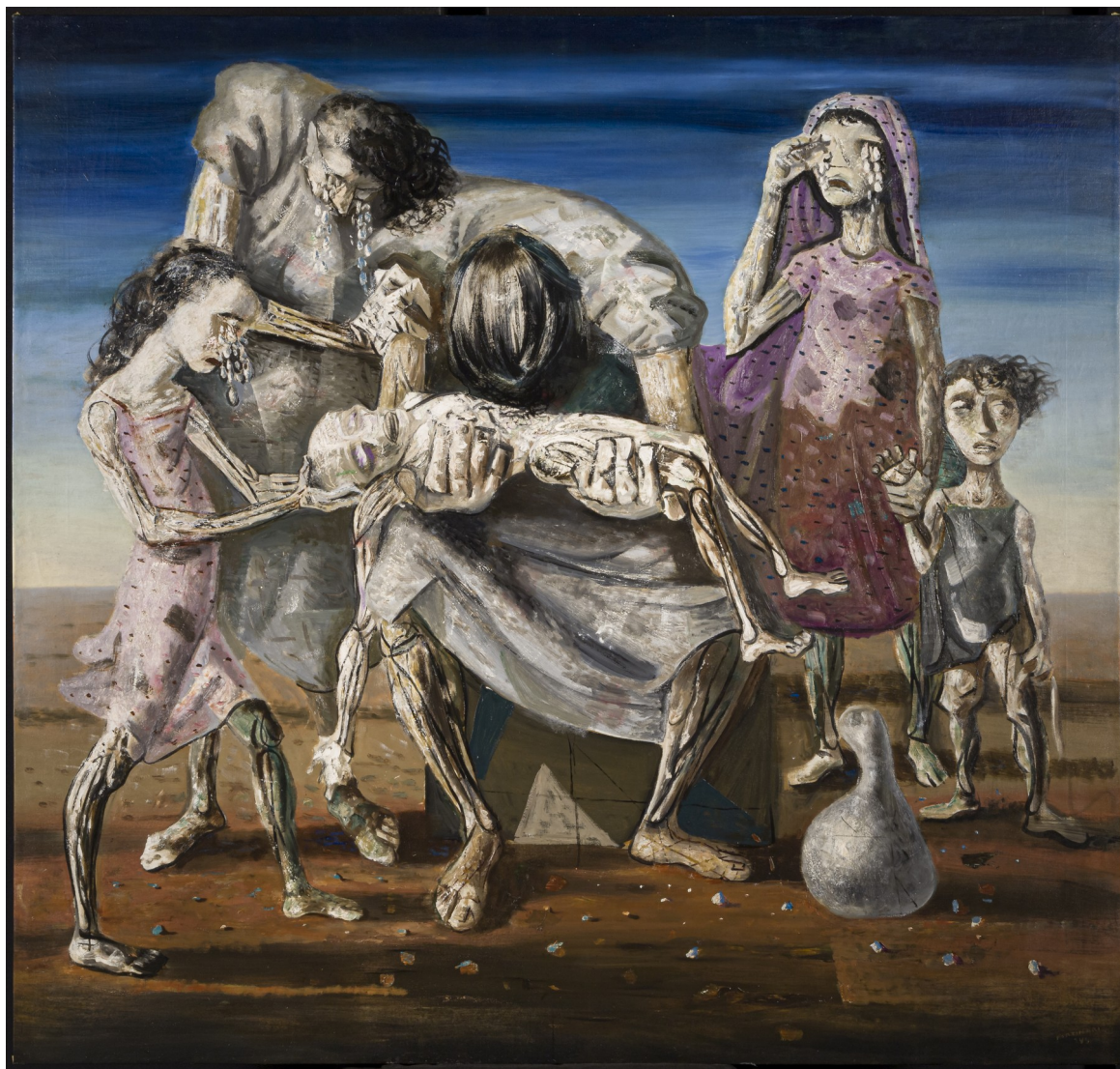
Criança Morta, 1944.

fim de tudo, as mães representam a dor vivida, sentida intensificando ainda mais a dor que podemos perceber na imagem.