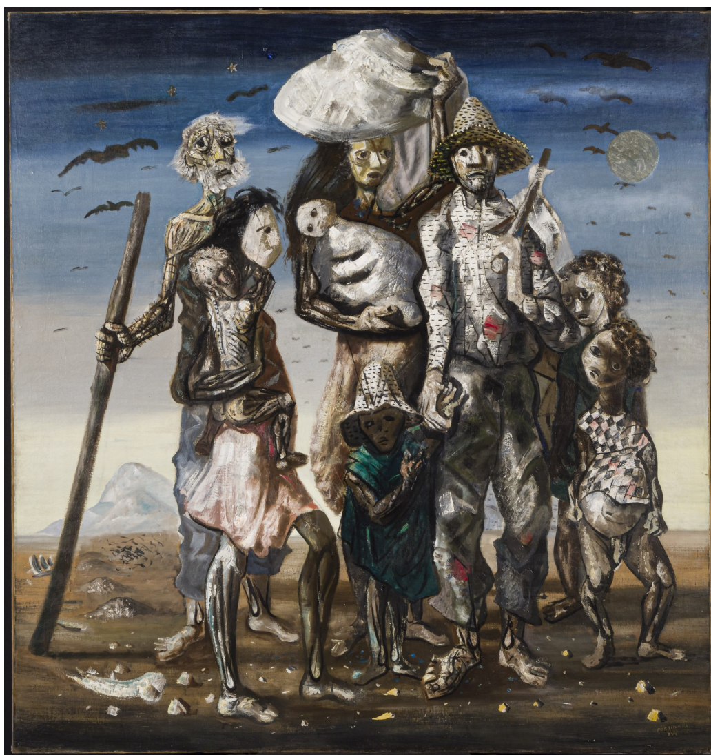
Retirantes, 1944.

morta” e “Enterro na rede”. Pintura a óleo, com a dimensão de 190 cm por 180 cm, hoje se encontra no Museu de Arte de São Paulo. Na tela, Portinari apresenta uma família retirante que compõe a paisagem fosca que invoca secura . No chão há pedras e pedaços de ossos, sinal de muitas mortes que ocorreram no caminho para uma vida melhor. O olhos bem abertos em rostos pálidos e cansados ressaltam a expressão de fome, tristeza, incerteza, todos estão descalços. No centro está uma mulher com uma trouxa na cabeça e um bebê no colo. Portinari coloca em muitas de suas séries a figura feminina como central, evoca uma imagem mariana. Aqui, Maria com o menino Jesus.